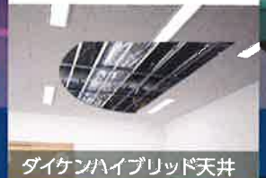
ダイケンハイブリッド天井