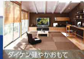
ダイケン健やかおもて